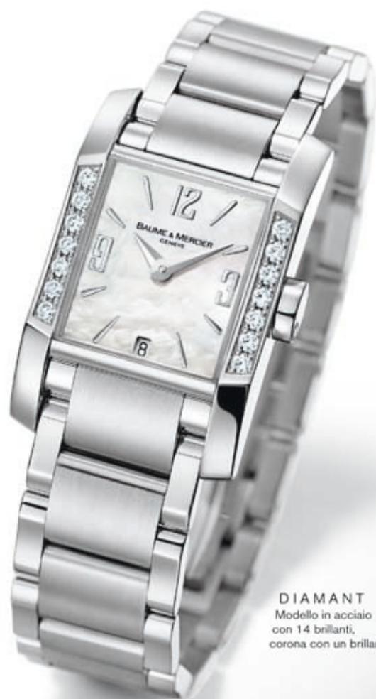
DIAMANT Modello in acciaio con 14 brillanti, corona con un brillante