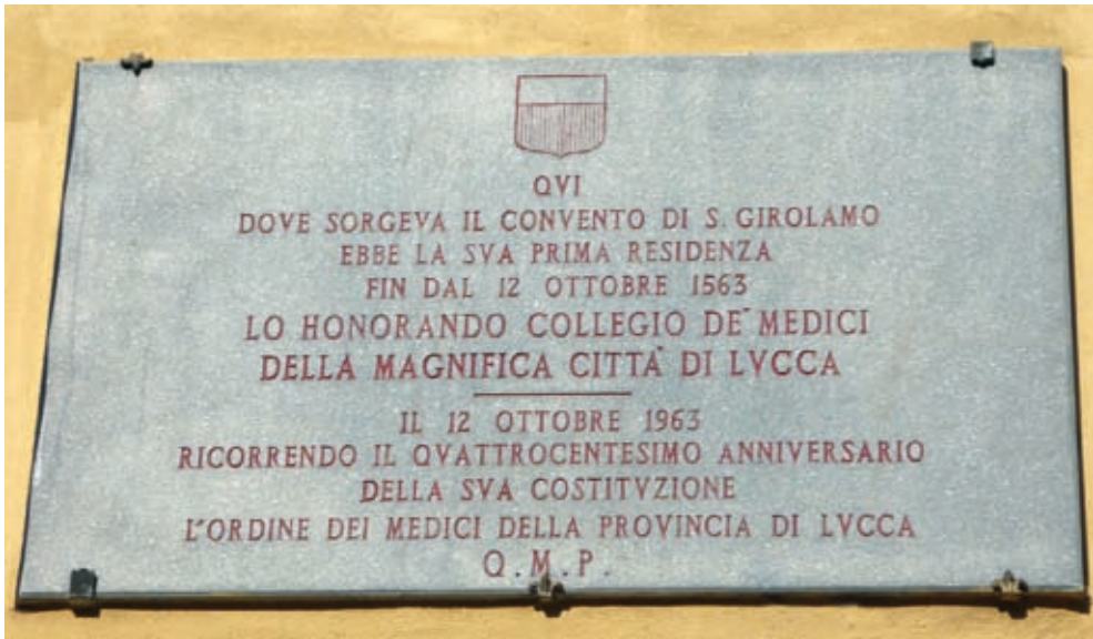
La targa collocata in Corso Garibaldi il 12 ottobre del 1963, in occasione dei 400 anni dell'Ordine dei Medici di Lucca. In quell'edificio, infatti, il 12 ottobre del 1563 l'Ordine ebbe la sua prima sede.

tuzionale della Riforma del 9 maggio 1567 con la quale all'Honorando Collegio "fuit data auctoritas condemnandi medicos (chirurgos et barbitonsores contravvenientes corum praeceptis usque in florinum unum pro capite" e poiché tale pena pecuniaria dovette apparire insufficiente o inefficace il 20 gennaio 1572 tale "auctoritas fuit adiuncta usque in florenos decem".