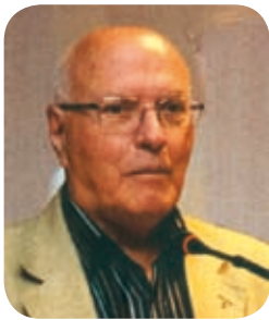
a cura del delegato Umberto Della Maggiore