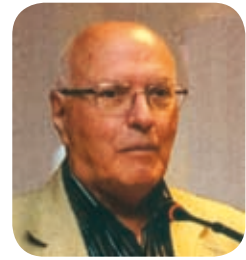
a cura del delegato Umberto Della Maggiore

Tutti gli iscritti che entro il 31 luglio hanno inviato all'ENPAM la dichiarazione dei redditi liberi professionali, riceveranno dalla Banca Popolare di Sondrio l'apposito bollettino e un prospetto esplicativo del calcolo effettuato dall'ENPAM per determinare l'importo da pagare. La scadenza per il pagamento è il 31 ottobre 2009. L'ENPAM comunica che il mancato ricevimento del bollettino MAV non esonera dall'obbligo del versamento contributivo dovuto.